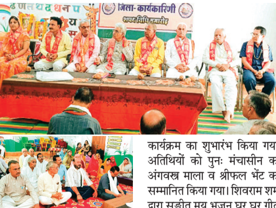
हरिभूमि न्यूज़ ▶▶ अशोकनगर

विश्व गीता प्रतिष्ठानम उज्जयिनी शाखा अशोकनगर के तत्वावधान में जिला अशोकनगर की नवीन कार्यकारिणी के शपथविधि समारोह का आयोजन रविवार को स्वामी विवेकानंद उच्चतर माध्यमिक विद्यालय के सभागार में आयोजित किया गया।